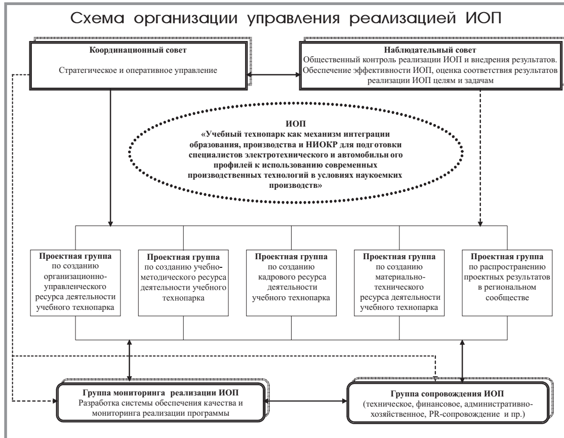
Схема организации управления реализацией ИОП

для обучающихся по профессиям и специальностям, заявленным в программе профилей), модернизация средств и методов образовательного процесса (в соответствии с принципом обучения в деятельности и в контексте предстоящей профессиональной деятельности), кардинальное изменение уровня оснащенности учебно-производственного процесса и его учебно-методического обеспечения, творческие контакты представителей высшей школы, занимающихся НИОКР, ведущих специалистов производства и преподавателей техникума в решении задач инновационной образовательной программы позволят максимально сократить (в перспективе - исключить) отставание учреждения профессионального образования от реальных процессов развития производства, установить баланс между требованиями современного производства к выпускнику и уровнем компетенций последнего, обеспечить конкурентоспособность и мобильность специалистов на рынке труда за счет расширения профиля их подготовки.